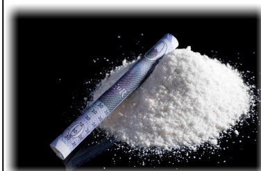
La méphédron, nouvelle drogue de synthèse.

La vocation première du laboratoire ChemTox est de répondre quotidiennement aux missions confiées par les magistrats et officiers de police judiciaire dans le cadre d'expertises judiciaires. Son activité principale est de mettre en évidence et de dos er le plus large panel de toxiques dans les diverses matrices biologiques ou sur tout autre support, mais aussi d'interpréter les résultats sous la forme d'un rapport d'expertise . Ce numéro fait également le point sur les domaines de compétence du laboratoire à travers un tableau récapitulatif des investigations médico-légales réalisables ( lire notre article page 4 ).