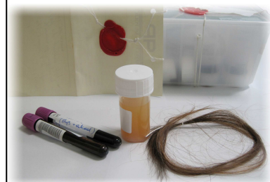
Echantillons soumis à l'analyse : sang, urine, cheveux, mais également les produits de saisies.