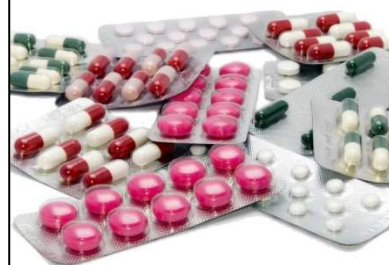
Les gélules de Méphédrone font leurs apparitions en 2007, date de la première saisie en France.